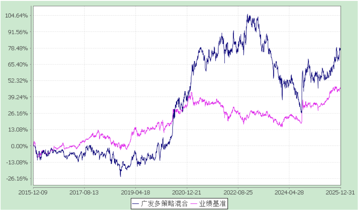
广发多策略灵活配置混合型证券投资基金 过去五年基金净值增长率与业绩比较基准收益率的对比图