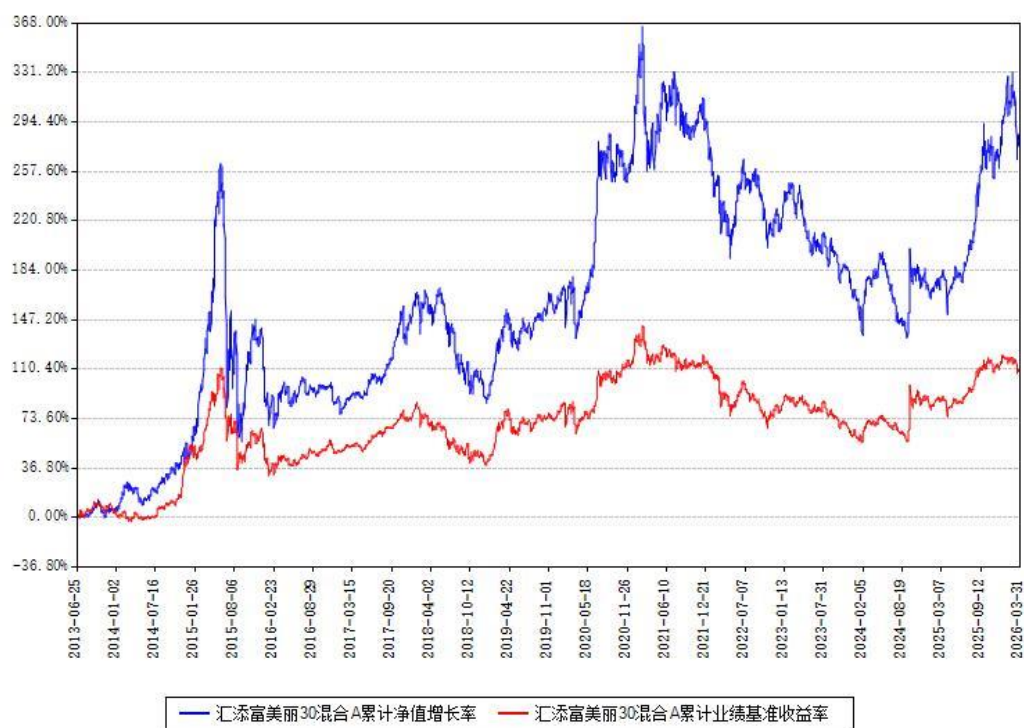
汇添富美丽30混合A累计净值增长率与同期业绩基准收益率对比图

(二) 自基金合同生效以来基金累计净值增长率变动及其与同期业绩比较基准收益率变动的比较图